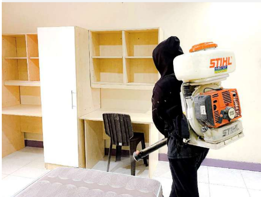
定期的に大規模消毒