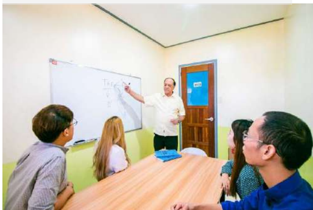
少人数グループクラス(1:4)