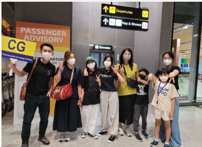
スクールマネージャーによる空港ピックアップ