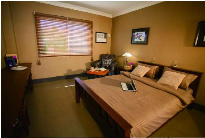
DELUXE SINGLE QUEEN SIZE x 1