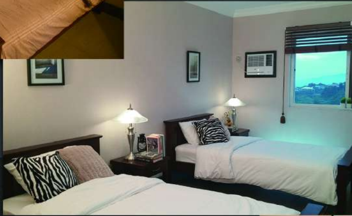
DELUXE DOUBLE SINGLE SIZE x 2