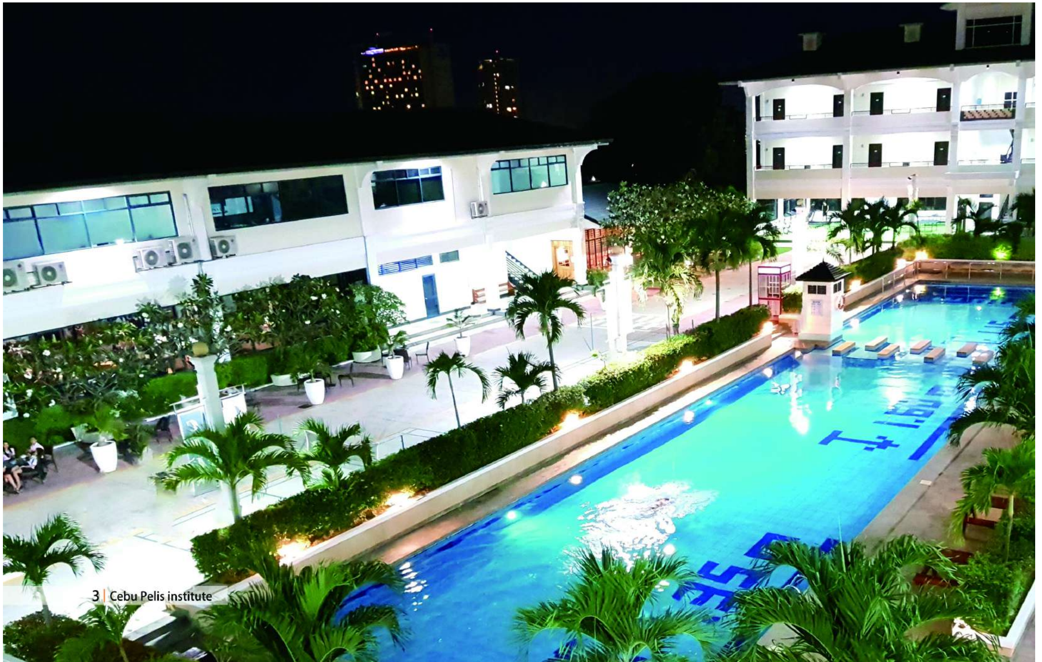
3 | Cebu Pelis institute