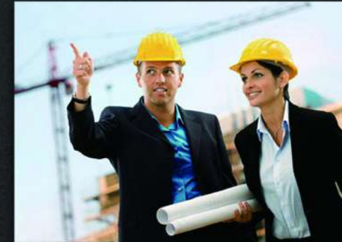
ENGLISH AT WORK