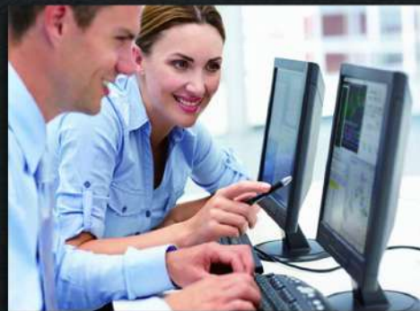
English for Information Technology