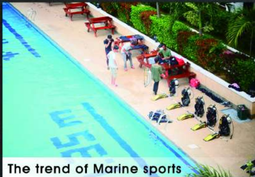
The trend of Marine sports

全世界の多くのダイバーが訪れる 有名ダイビングポイントのセブと周りの島。 海の中で泳ぐ楽しさを体験しましょう！