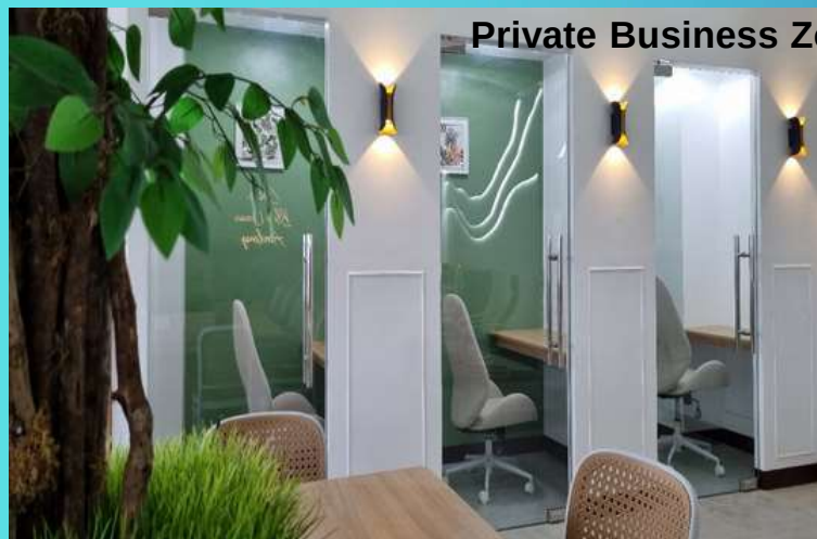
Private Business Zoom Meeting Room