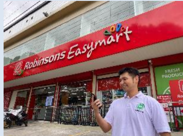
学校から徒歩3分の大型スーパー前にて

学校から車で10分の NEPOモールにて プリペイドロードカード を購入可能。プランは 多々あり、500ペソで 約50GB＝動画を約 80時間視聴可能 (有効期間1ヶ月)。