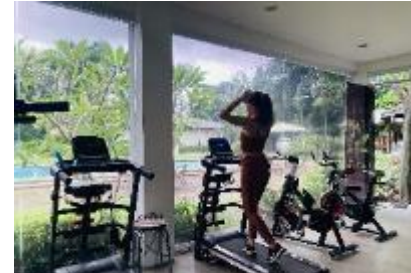
キャンパス内の新築ジム