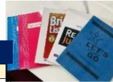
小学生以上の方向け教材一例

当校の親子留学における最大の特徴は、4歳～小学校未就学児の方には毎日のカリキュラムが組まれた幼稚園を自前で保有していることです。同幼稚園では科目ごとに教材・ツールもご用意しており、万一生徒が1人となっても、最低講師とスタッフが計2名以上ついていきますので安心です。小学校～中学3年生のお子様は、講義棟でジュニアの指導経験が豊富なフィリピン人『JUNIOR ESL COURSE』か、欧米ネイティブ講師のマンツーマン授業2コマを含む『JUNIOR ESL NATIVE COURSE』何れかのコースで学んで頂きます。勿論、教材は幼稚園用・小学生以上用(中学卒業まで)に分かれており、それぞれ豊富にご用意しております。