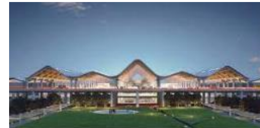
クラーク新国際空港