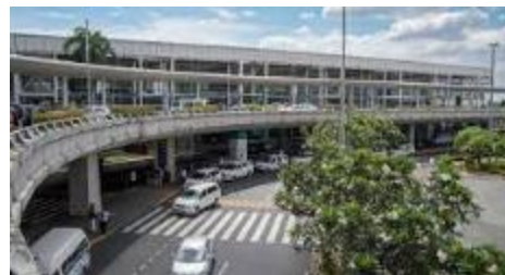
マニラ国際空港 (ターミナル2)

コロナ前までもクラーク⇔マニラ北部間は高速道路が開通していたものの、マニラの中心部にあるマニラ国際空港から高速道路間の渋滞がひどく、マニラ⇔クラーク間は2時間～、渋滞状況によっては4時間かかっていました。その後、2020年に『SKYWAY』という高速道路がマニラ国際空港近くからクラーク間全面開通したことで、現在は安定してマニラ国際空港⇔クラーク間の移動は片道約2時間（最速1時間40分）で可能となっています。