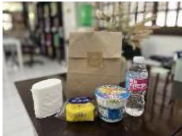
到着時の無料ウェルカムセット