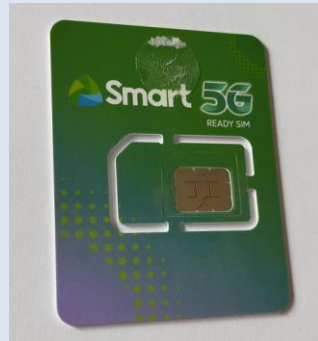
校内売店で販売のSIMカードは約100円