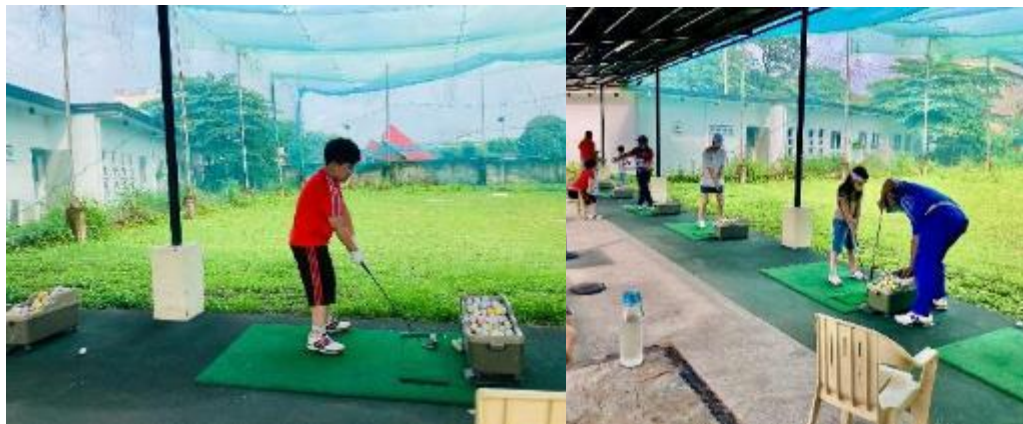
WE ACADEMYキャンパス内のゴルフ練習場