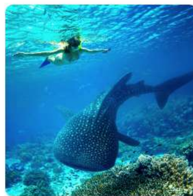
オスロブ ジンベエザメツアー