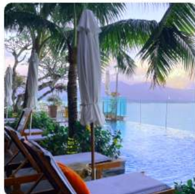
プレミアムリゾート日帰り旅行