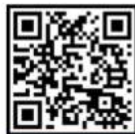
2. サイズ測定チェックリスト