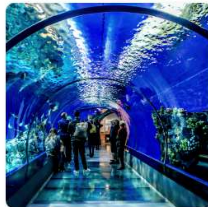
セブオーシャンパーク & SMシーサイドモールツアー