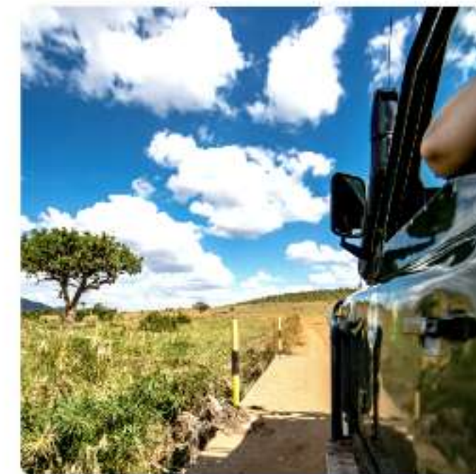
セブサファリ&アドベンチャーパーク