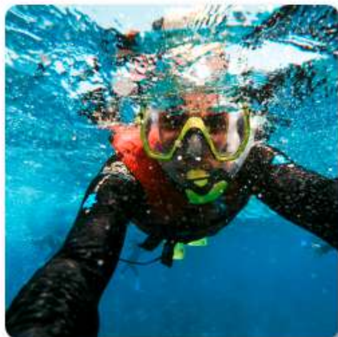
アイランドホッピングツアー