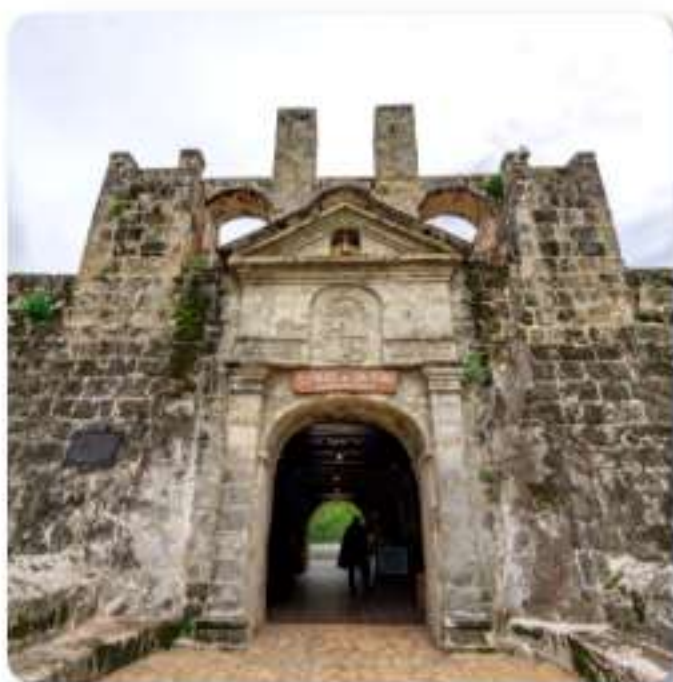
セブ市内歴史ツアー