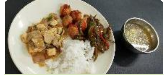
豚肉の豆腐和え、茄子炒め、野菜ボール（団子）、スープ