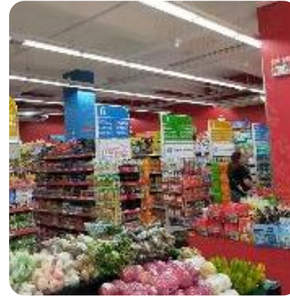
徒歩3分の大型スーパー店内