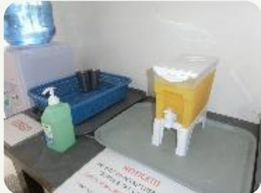
ドリンクと 複数台ある水・湯サーバー