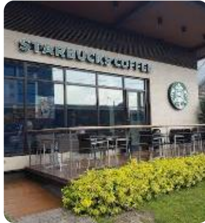
モール付近のスターバックス