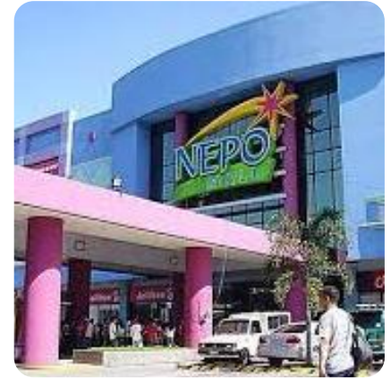
徒歩約20分のNEPOモール