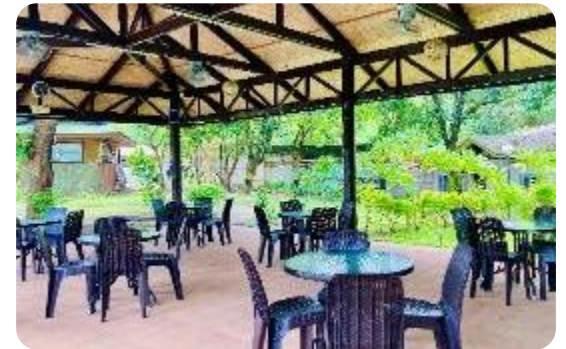
プールサイドに位置する憩いの場