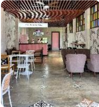
徒歩3分のカフェ&ドーナツ店は 生徒様の憩いの場