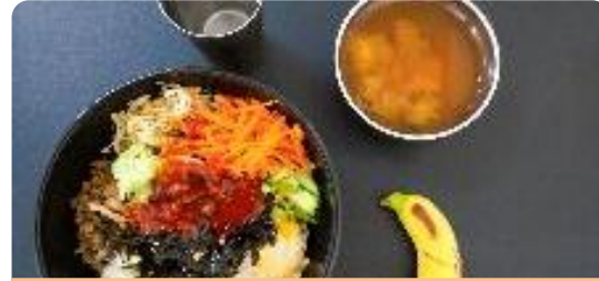
ビビンバ丼、韓国風豆腐スープ、バナナ