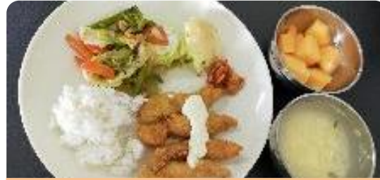
エビフライ、野菜炒め、ポテトサラダ、玉子スープ、メロン