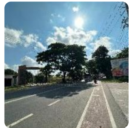
当校前の幹線道路