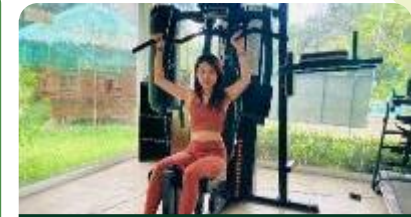
キャンパス内の新築ジム

又、気になる寮のお部屋も各室内にきれいなシャワー&トイレルームが設置されていますのでご安心ください。