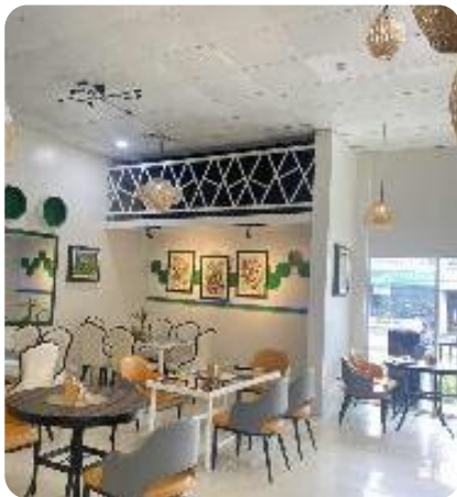
徒歩3分圏内にあるラザニア店とステーキハウス