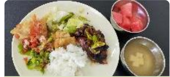
鳥のグリル焼き、サラダ、トマト、練り物のソテー、豆腐スープ、スイカ