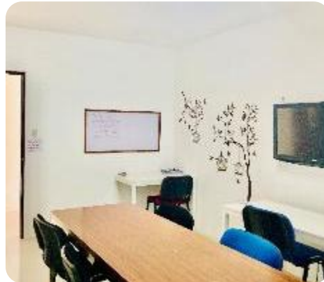
グループ教室には大モニターも完備