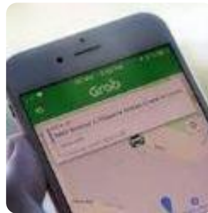
Grab TAXIアプリは欠かせません