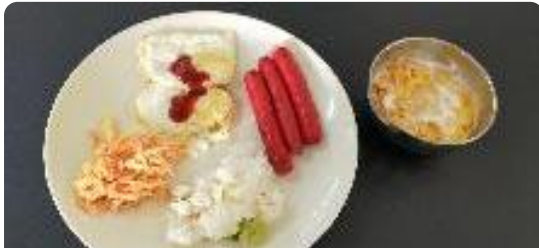
ガーリックフライドライス、ソーセージ、目玉焼き、コールスローサラダ、コーンフレーク