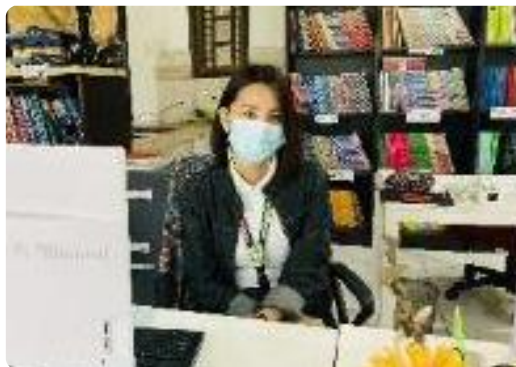
お子様向けのものを含め 豊富な教材をご用意しています！