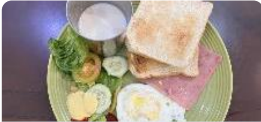
トースト、ハム、目玉焼き、生野菜、牛乳