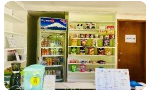
ビール・コーヒー・ドリンク・お菓子・カップ麺等を販売