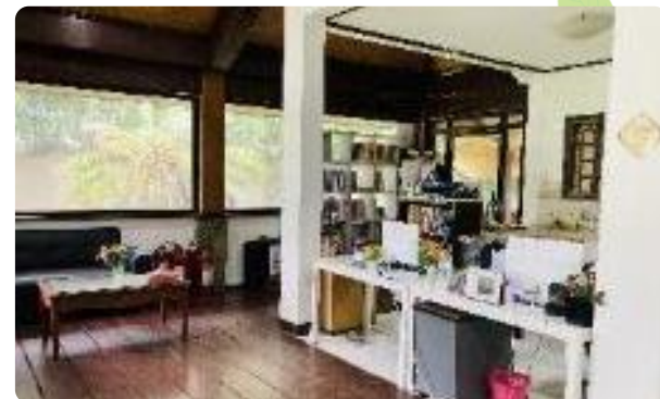
生徒様が気軽に相談にのれるよう 設計したオフィス