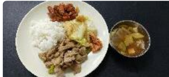
豚肉炒め、野菜炒め、ソーセージのソテー、キムチ、野菜スープ