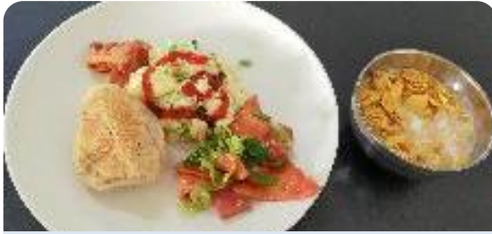
雑穀パン、野菜入り玉子焼き、キムチ、ソーセージの細切り炒め、コーンフレーク