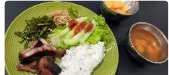
焼き豚、サラダ、ニラ炒め、もやし炒め、豆腐スープ、メロン